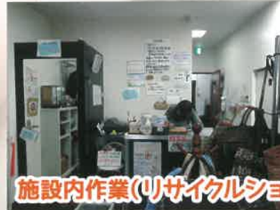
施設内作業(リサイクルショップはっぴい)