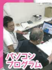
パソコンプログラム

パソコン基本技術の向上を目的に、1回あたり50分で月2日実施しています(主にword, excel)。検定試験(MOS, タイピング技能検定)に向けての練習も取り組んでいます。